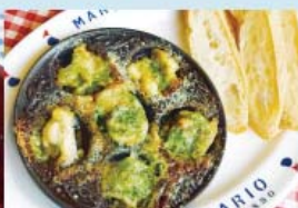
エビ・イカ・ホタテの ガーリックバター焼き ¥900