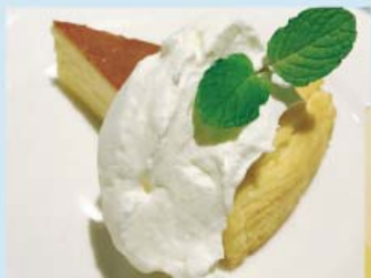
バイクドチーズケーキ ¥390