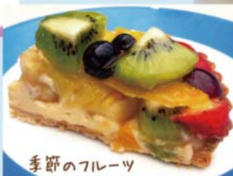
季節のフルーツ タルト ¥470