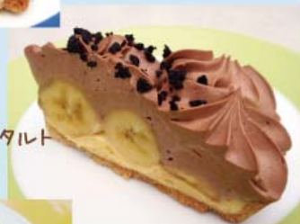
バナナチョコ タルト ¥390