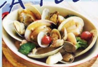
マリーナ名物!! 魚介のアヒージョ ¥1,480