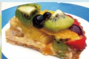
季節のフルーツタルト