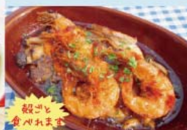
ソフトシェルシュリンプ アヒージョ ¥1,100