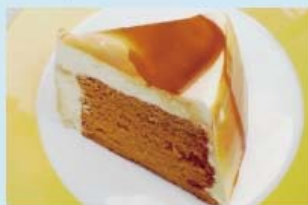
キャラメルシフォンケーキ