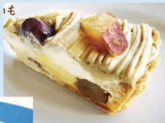
栗とさつまいも タルト ¥500