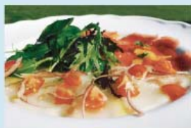
本日の鮮魚 カルパッチョ 2種盛り ¥1,200