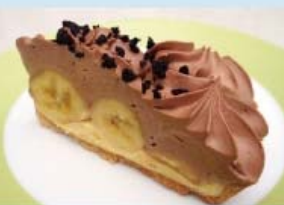
バナナチョコタルト