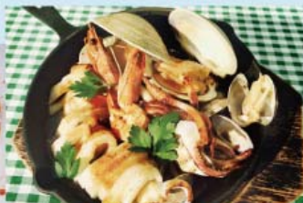
魚介の鉄板焼 焦がしバターソース ¥1,580