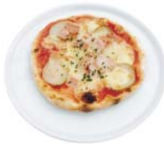
ハーフサイズ ピザ