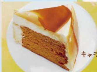
キャラメルシフォンケーキ ¥380