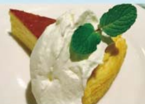
ホワイトチーズケーキ