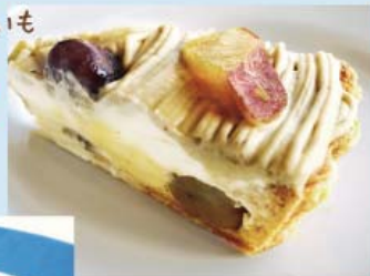
栗とさつまいも タルト ¥500