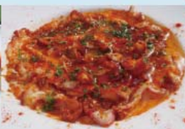
タコのバリ辛 ガーリックオイル焼き ¥800