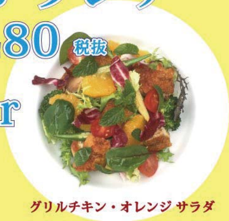
グリルチキン・オレンジ サラダ