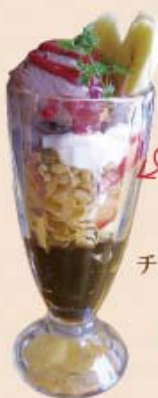
チョコバナナ パフェ ¥650