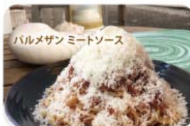
バルメザン ミートソース