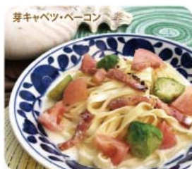
芽キャベツ・ベーコン