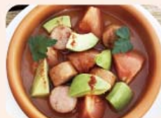
7) アボカド ソーセージ・トマト ¥680