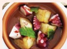
3) タコ・ポテト アンチョビ ¥680