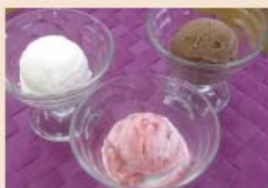
井口「Latte Latte」の ジェラート各種 ・ラッテ (ミルク) ・つぶつぶチョコ ・莓マール ・季節のおすすめ