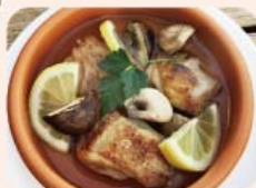
6) 鶏モモ肉 ブラウンマッシュ ¥680