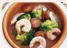
2) エビ・ミニトマト ブロッコリー ¥680