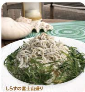
しらすの富士山盛り