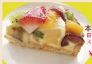
本日のタルト 日替わりタルトのため、詳しくは スタッフまでお尋ねください。 ¥470～