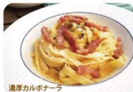
濃厚カルボナーラ