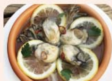
4) 広島カキ 舞茸・レモン ¥680