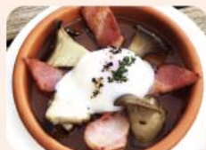
8) 温玉・ベーコン エリンギ ¥680