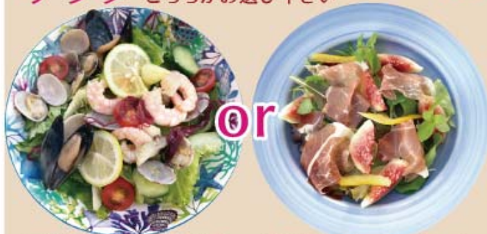
アサリ・エビ・ムール貝 レモンマリネ サラダ