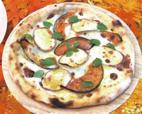
かぼちゃ・さつまい ゴルゴンゾーラ秋味