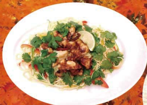
イカの唐揚げ・パプリカ パクチー風味