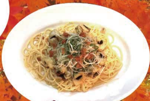
ハモと梅肉の薬味和え