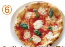
⑥ モッツァレラ・バジリコ マルゲリータ