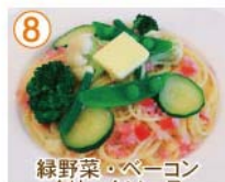
⑧ 緑野菜・ベーコン クリームソース