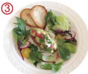
③ お馴染みのまぐろ アボカド タルタル