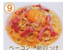
⑨ ベーコン・卵のつけ カルボナーラ