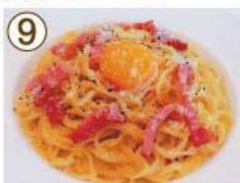
⑨ ベーコン・卵のつけ カルボナーラ