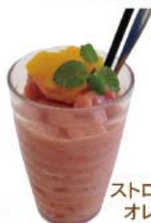
ストロベリー オレンジ