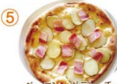
⑤ ベーコン・ポテト・チーズ