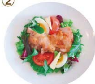
グリルチキン・トマト グリーンサラダ