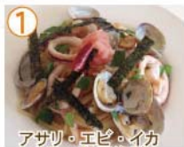
① アサリ・エビ・イカ タラコ 和風海鮮