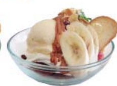
キャラメルバナナ ボウル