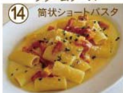
⑭ ベーコン・かぼちゃ クリームリガトーニ