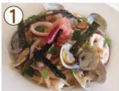
① アサリ・エビ・イカ・タラコ 和風海鮮