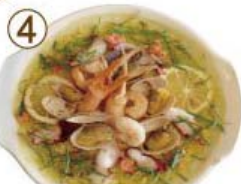
④ タラコ・海鮮・昆布だし 大葉ライス