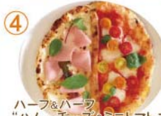
④ ハーフ&ハーフ “ハム・チーズ&ミニトマト マルゲリータ”