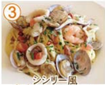
③ シシリイ風 魚介ペロンチーノ