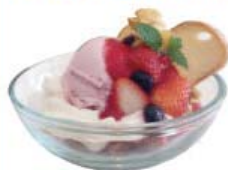
ストロベリー ボウル