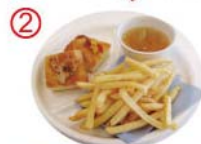
② フライドポテトプレート