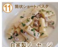
⑪ 筒状ショートパスタ 自家製ソーセージ チーズクリーム リガトーニ