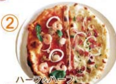
② ハーフ&ハーフ “ペスタトーレ&ベーコン・オニオン”