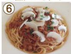
⑥ マッシュルーム・チーズ ミートソース