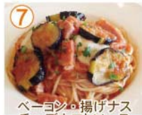
⑦ ベーコン・揚げナス チーズトマトソース