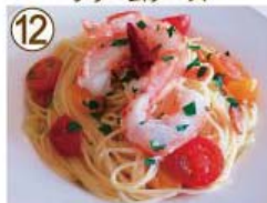
⑫ エビ・ミニタト ペペロンチーノ