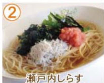
② 瀬戸内しらす 広島菜・たらこ