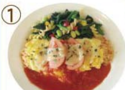
① トマトチーズ オムライス