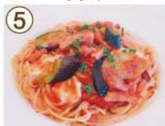
⑤ ベーコン・揚げナス チーズトマトソース