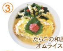
③ たらこの和風 オムライス