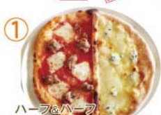
① ハーフ&ハーフ “自家製ソーセージ&4種のチーズ”