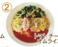
② トマト チーズ オムライス