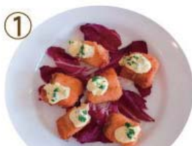
ノルウェー産 サーモンフライ