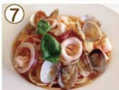
⑦ シーフード・アンチョビ ペスカトーレ