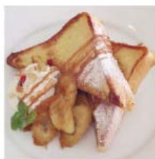
バナナキャラメル フレンチトースト