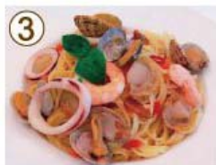
③ シシリー風 魚介ペロンチーノ