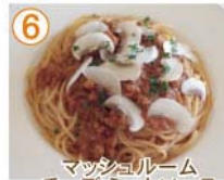
⑥ マッシュルーム チーズ ミートソース