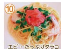
⑩ エビ・たっぷりタラコ クリームソース