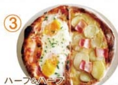
③ ハーフ&ハーフ “目玉焼き&ベーコン・ポテト”