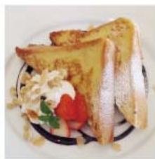
チョコホイップ フレンチトースト