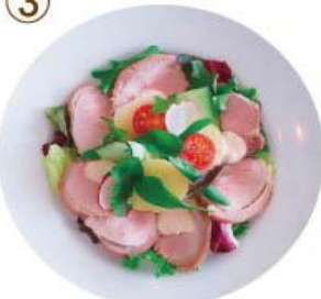
ローストポーク・ツナソース コンビネーション