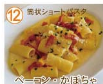
⑫ 筒状ショートパスタ ベーコン・かぼちゃ クリーム リガトーニ