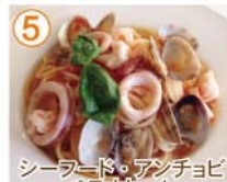
⑤ シーラード・アンチョビ ペスタトーレ