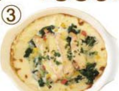
③ チキンクリーム ライスグラタン