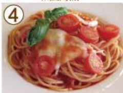
④ モッツァレラチーズ トマトソース