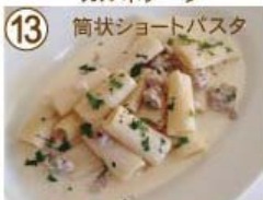
⑬ 自家製ソーセージ チーズクリームリガトーニ