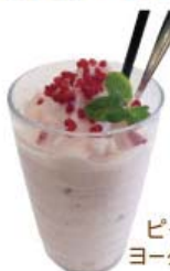
ピーチ ヨーグルト