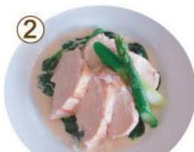
チキン ソテー チーズクリームソース