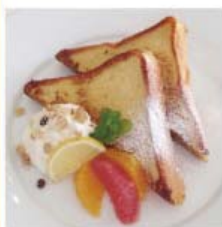
シトラスハニー フレンチトースト