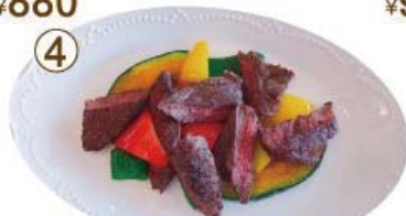
牛ハラミ ステーキ (120g)