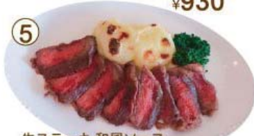
牛ステーキ 和風ソース 又はんにく醤油ソース (120g)