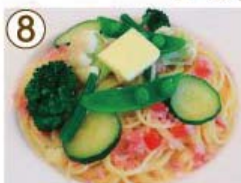
⑧ 緑野菜・ベーコン クリームソース