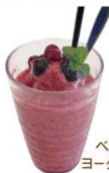
ベリー ヨーグルト