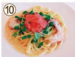
⑩ エビ・たっぷりタラコ クリームソース