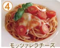
④ モッツァレラチーズ トマトソース