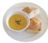
スープ・フォカッチャ