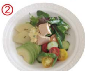
② みんな大好き アボカドニース