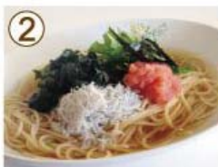
② 瀬戸内しらす・広島菜 タラコ