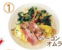
① ベーコン クリーム オムライス