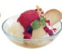
ピーチベリー ボウル