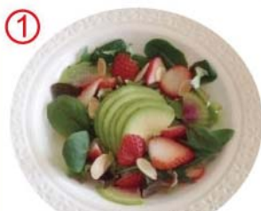
① いちご・アボカド フレッシュフルーツ