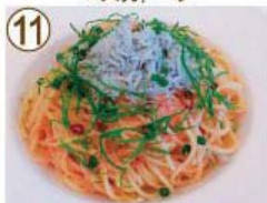
⑪ 焼きタラコ・しらす ペペロンチーノ