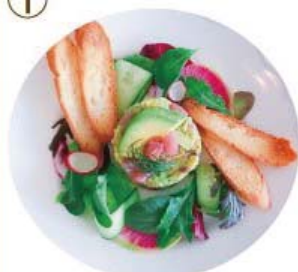
お馴染みのまぐろ アボカド タルタル