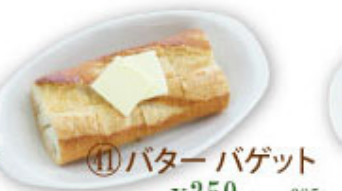
④⑪ バターバケット ¥350 (税込¥385)