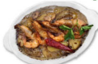
③⑭ 殻ごと食べられるエビ ¥1,180 (税込¥1,298)