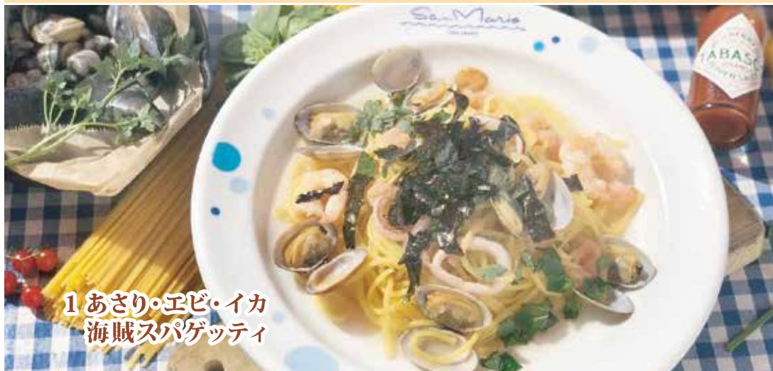
1 あさり・エビ・イカ 海賊スパゲッティ