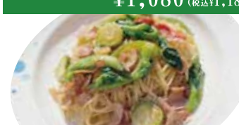
⑩ ベーコン・春野菜 ペペロンチーノ ¥1,080 (税込 ¥1,188)