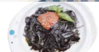
⑤ イカスミスパゲッティ ¥1,080 (税込 ¥1,188)