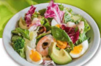
③⑪ エビ・アボカド・半玉 サラダ ¥800 (税込¥880)