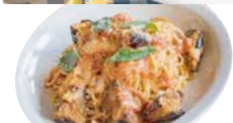
④ ナス・モッツアレラ パルメザントマトソース ¥1,080 (税込 ¥1,188)