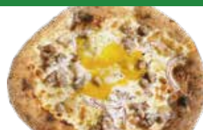
⑳ 自家製ベーコン・サルシッチャ 温玉・オニオン レギュラー ¥1,380 (税込 ¥1,518) スモール 780 (¥858)