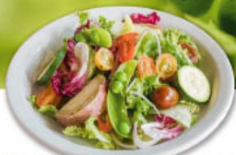
③⑫ 彩り野菜・カラフルトマト サラダ ¥800 (税込¥880)