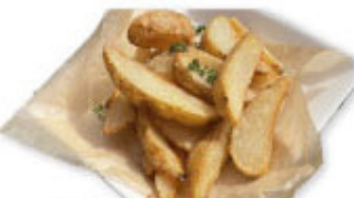
④⑯ トリュフポテト ¥480 (税込¥528)