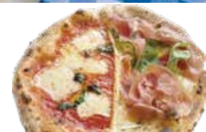
⑱ 生ハムピザ+マルゲリータ ハーフ&ハーフ レギュラーのみ ¥1,480 (税込 ¥1,628)