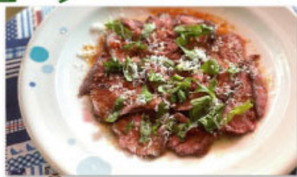
③⑱ 自家製ローストビーフ ¥1,280 (税込¥1,408)