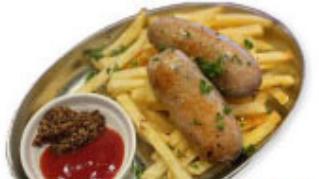
④⑰ 自家製ソーセージ&ポテト ¥880 (税込¥968)