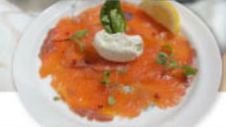
④⑬ 自家製スモークサーモン バジル風味のクリーム添え ¥980 (税込¥1,078)