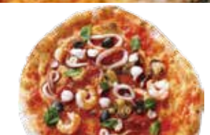
⑰ シーフード・オレガノ ニンニク レギュラー ¥1,380 (税込 ¥1,518) スモール 780 (¥858)