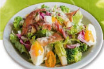
③⑩ 生ハム・半玉 シーザーサラダ ¥900 (税込¥990)