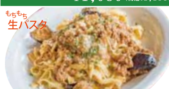
⑧ ナス・モッツアレラ ミートソース タリアテッレ ¥1,080 (税込 ¥1,188)