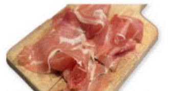
④⑱ スペイン産生ハム ¥780 (税込¥858)