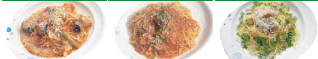
5 チキン・ナス・アスパラ モッツアレラのトマトソース