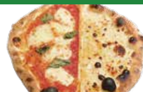
㉑ ハチミツ・ゴルゴンゾーラ+ マルゲリータのハーフ&ハーフ レギュラーのみ ¥1,380 (税込 ¥1,518)