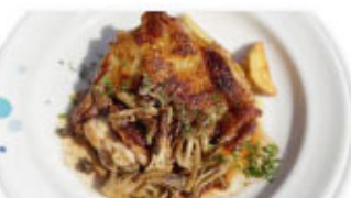
⑤⑰ 鶏モモ肉とキノコのロースト 焦がしバターソース ¥1,180 (税込¥1,298)