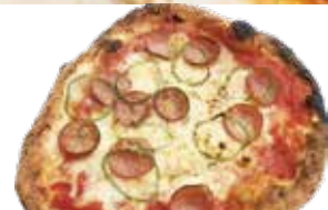
⑯ サラミ・オニオン モッツアレラ レギュラー ¥1,280 (税込 ¥1,408) スモール 680 (¥748)