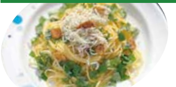
⑥ シラス・青じそ・ゆず胡椒 ペペロンチーノ ¥1,080 (税込 ¥1,188)