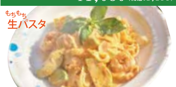
⑨ エビ・アボカド トマトクリームタリアテッレ ¥1,080 (税込 ¥1,188)