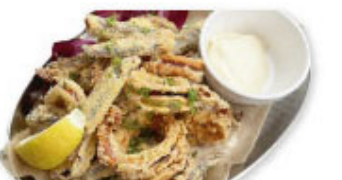
⑤⑱ イカと広島産小イワシ フリット ¥980 (税込¥1,078)