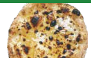
⑲ ハチミツ ゴルゴンゾーラ クリーム レギュラー ¥1,280 (税込 ¥1,408) スモール 680 (¥748)