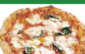
㉔ 国産生モッツアレラ・バジル マルゲリータ スペシャル レギュラー ¥1,480 (税込 ¥1,628) スモール 880 (¥968)