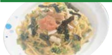
③ 蒸し鶏・紀州梅・タラコ スパゲッティ ¥980 (税込 ¥1,078)