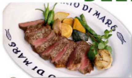
③⑰ 牛ロースのんにくステーキ ¥2,180 (税込¥2,398)