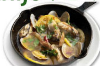
③⑮ 広島カキ・あさり・青じそ・レモン ¥1,380 (税込¥1,518)