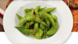
④⑭ 枝豆のペペロンチーノ ¥480 (税込¥528)