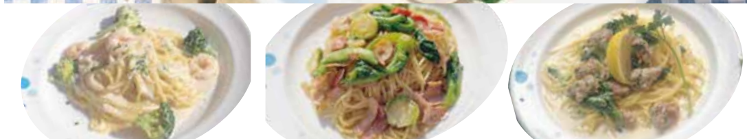
2 エビ・ブロッコリー タラコクリーム