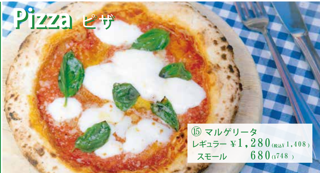
⑮ マルゲリータ レギュラー ¥1,280 (税込 ¥1,408) スモール 680 (¥748)