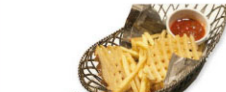
⑤⑵ ミックスフライドポテト ¥580 (税込¥638)