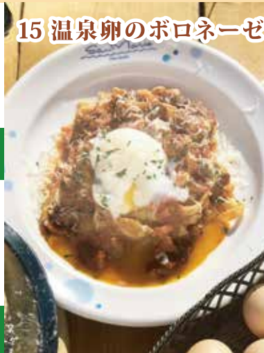
15 温泉卵のボロネーゼ