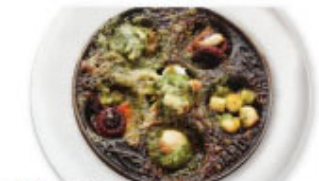
⑤⑲ エビ・イカ・タコ ガーリックバター焼 ¥880 (税込¥968)