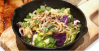
④⑮ シラス・青じそ アンチョビキャベツ ¥580 (税込¥638)