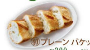
④⑩ プレーンバケット ¥300 (税込¥330)