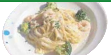
② エビ・ブロッコリー タラコクリームスパゲッティ ¥980 (税込 ¥1,078)