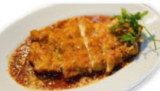
⑤⑳ 鶏胸肉のカツレツ トマトソース ¥780 (税込¥858)