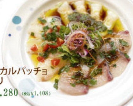
⑤⑶ 本日のカルパッチョ 3種盛り ¥1,280 (税込¥1,408)