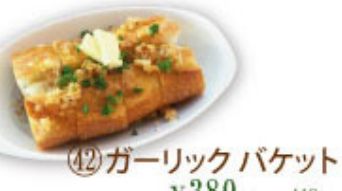
④⑫ ガーリックバケット ¥380 (税込¥418)