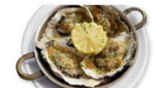
④⑲ 広島産牡蠣のオープン焼 2個 ¥980 (税込¥1,078) 4個 ¥1,960 (税込¥2,156)