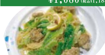
⑪ 春キャベツ・ハーブ鶏 レモンペペロンチーノ ¥1,080 (税込 ¥1,188)