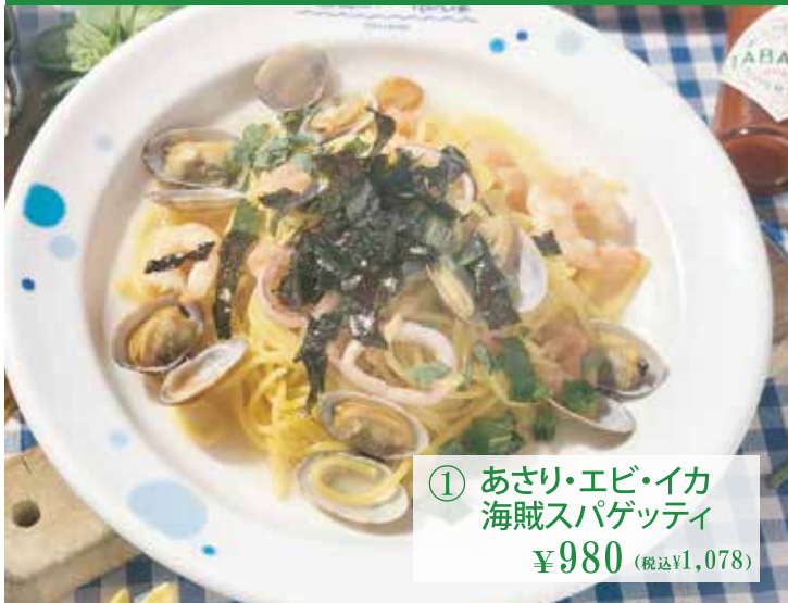
① あさり・エビ・イカ 海賊スパゲッティ ¥980 (税込 ¥1,078)