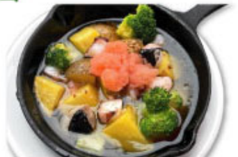
③⑯ タコ・ジャガイモ・タラコ ¥1,180 (税込¥1,298)