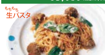
⑦ 自家製ミートボール・モッツアレラ トマトソースリングイネ ¥1,080 (税込 ¥1,188)