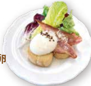
2. ベーコン・半熟卵 シーザーサラダ