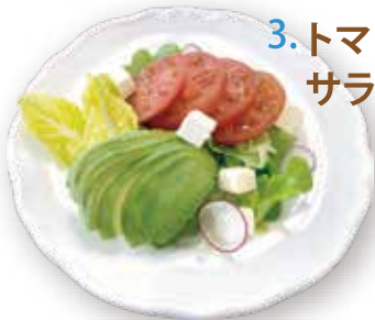
3. トマト・アボカド サラダ