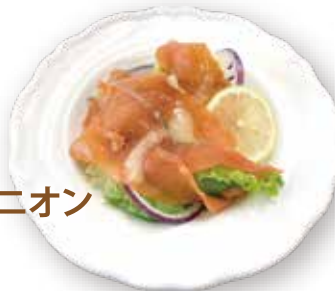
4. サーモン・オニオン サラダ