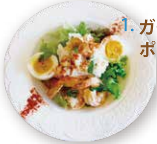
1. ガーリックシュリンプ ポテトサラダ