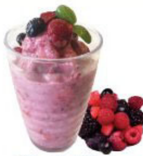
ベリーヨーグルト