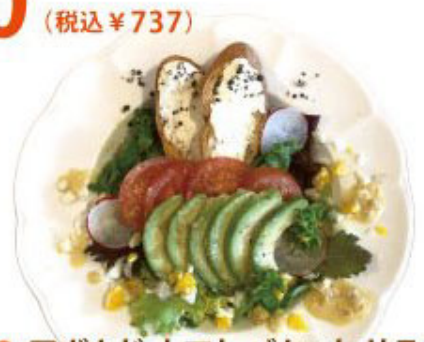
3. アボカド・トマトバケット サラダ パリパリドレッシング