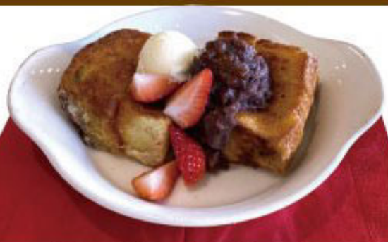
カリッ ふわっ パタートースト あんこ&バニラ