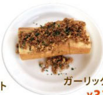
ガーリックバケット