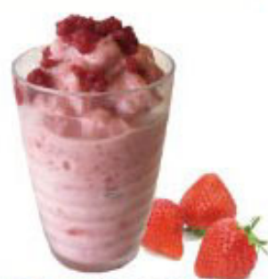
ストロベリーミルク