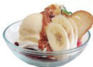
キャラメルバナナ