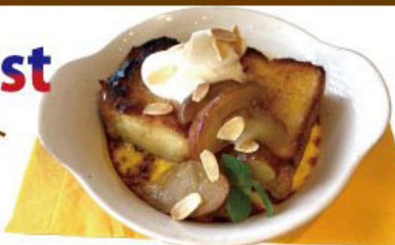
ふわットロ〜 フレンチ トースト リンゴコンポート&キャラメル