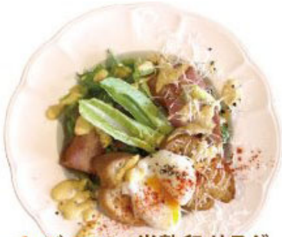
1. ベーコン・半熟卵 サラダ シーザードレッシング