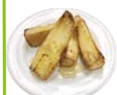
Honey butter Baguette