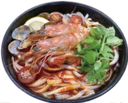
Tom yum goong Pho ¥1,320 (税込¥1,452)