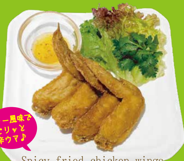
Spicy fried chicken wings 手羽先 スパイシー揚げ