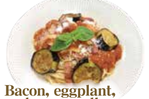
Bacon, eggplant, and mozzarella tomato sauce spaghetti