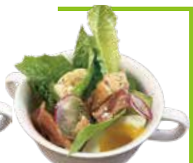
Half size Caesar's salad