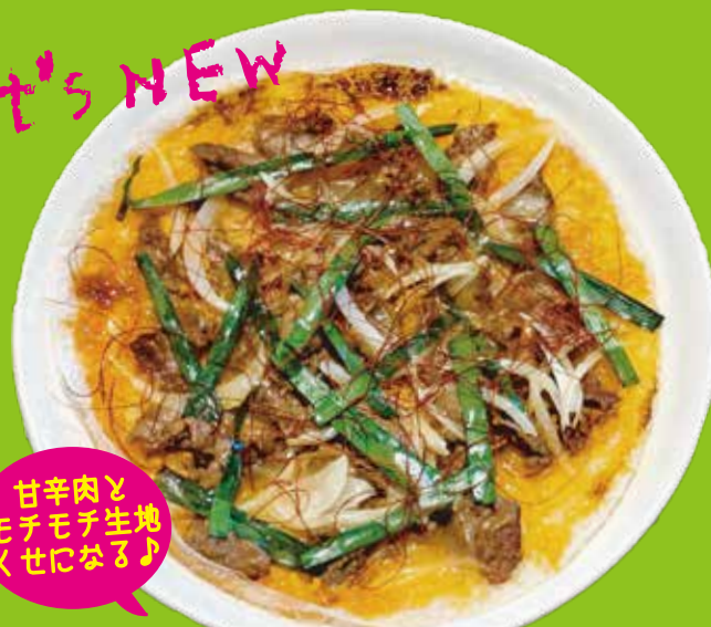
Bulgogi rice paper pizza フルコギ ライスペーパー ピザ