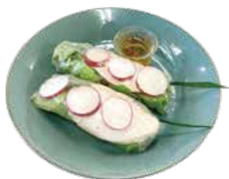
Row spring rolls in steamed chicken ¥700 (税込¥770)