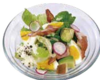
Caesar's salad with bacon,egg