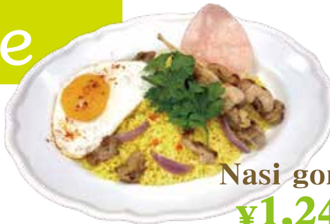
Nasi goreng ¥1,240 (税込¥1,364)