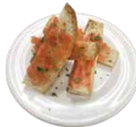
Cod roe Baguette ¥290 (税込¥319)