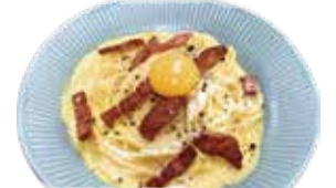
Bacon, egg carbonara spaghetti