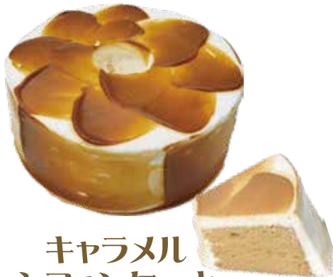
キャラメル シフォンケーキ ¥540 (¥594)