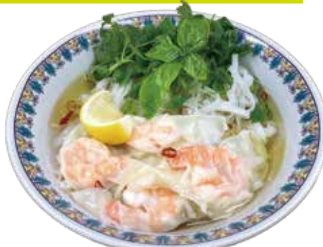
Shrimp wonton Pho ¥1,190 (税込¥1,309)