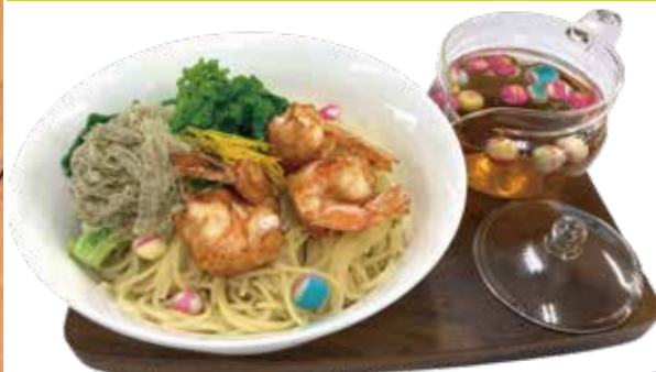
Soup spaghetti on shrimp dumpling ¥1,190 (税込¥1,309)