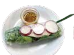
Row spring rolls in steamed chicken