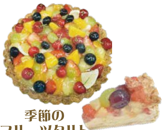
季節の フルーツタルト ¥820 (税込¥902)