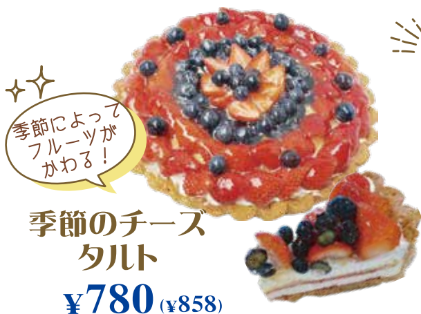
季節のチーズ タルト ¥780 (¥858)