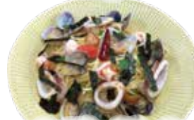
Spaghetti with clams shrimp, squid, cod roe