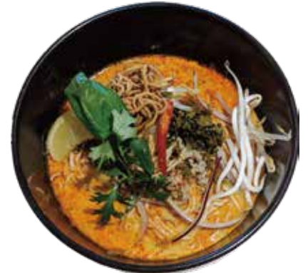
Khao soi ¥1,190 (税込¥1,309)