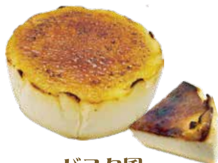
バスク風 チーズケーキ ¥500 (¥550)