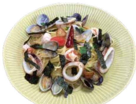
Spaghetti with clams, shrimp, squid, and cod roe