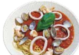
Clams, shrimp, squid tomato sauce spaghetti