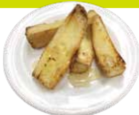
Honey butter Baguette ¥290 (税込¥319)