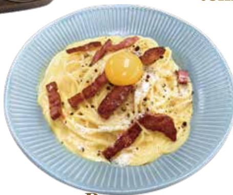
Bacon, egg carbonara spaghetti