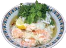
Shrimp wonton Pho