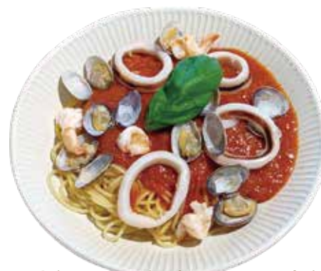
Clams, shrimp, squid tomato sauce spaghetti