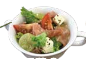
Half size Raw hamt salad