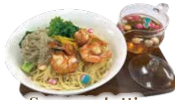
Soup spaghetti on shrimp dumpling