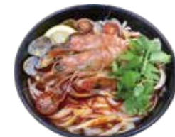
Tom yum goong Pho