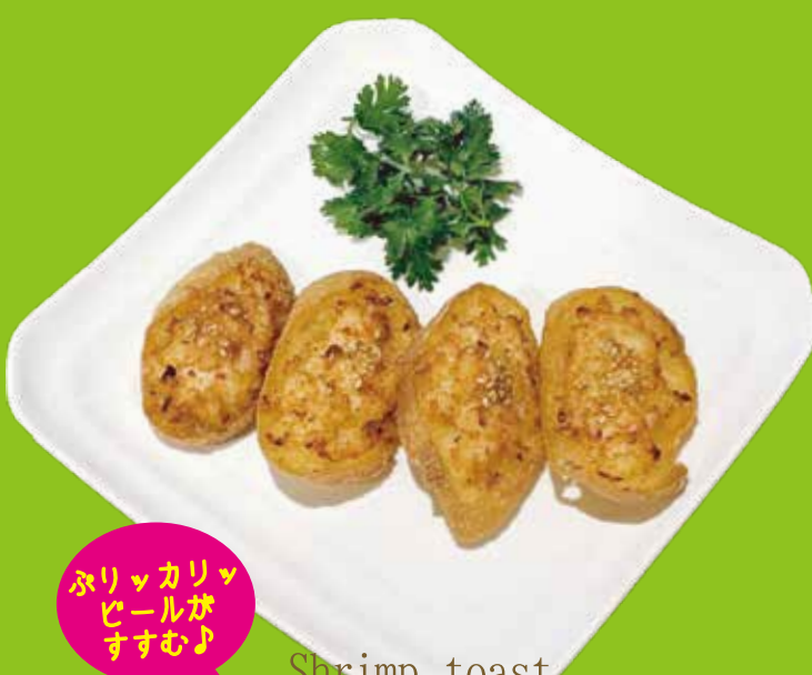
Shrimp toast ぷりぷり海老 トースト