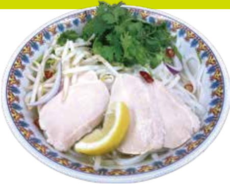
Steamed chicken Pho ¥1,190 (税込¥1,309)