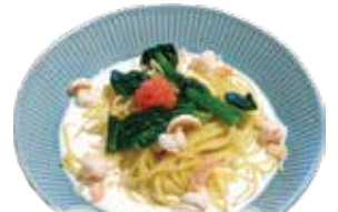
Shrimp, Tarako cream sauce spaghetti