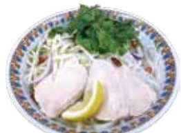
Steamed chicken Pho