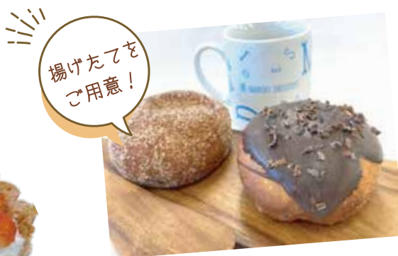
生ドーナツ 各種 ¥299~ (¥329)