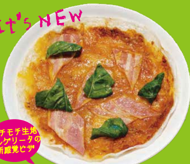
Margherita rice paper pizza ベーコン・マルゲリータ ライスペーパー ピザ