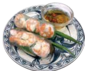
Row spring rolls in roast pork shrimp ¥700 (税込¥770)