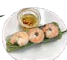
Row spring rolls in roast pork, shrimp