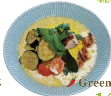
Green curry ¥1,240 (税込¥1,364)