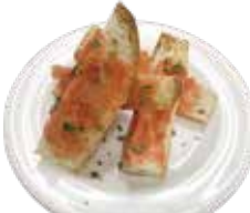
Cod roe Baguette