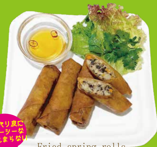
Fried spring rolls 具たくさん 揚げ春巻き