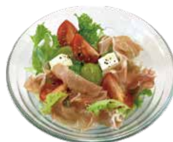
Row hum salad with cream cheese