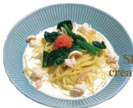
Shrimp, Tarako cream sauce spaghetti