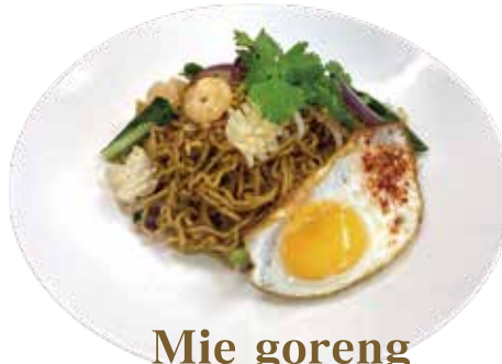
Mie goreng ¥1,190 (税込¥1,309)