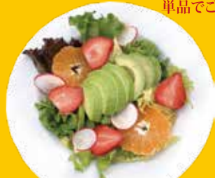
1. アボカド・フルーツ サラダ