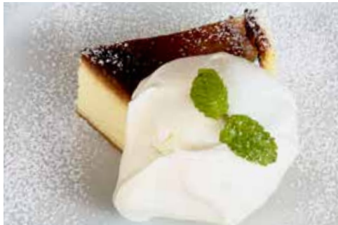
バスク風 チーズケーキ