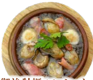
地御前 牡蠣・マッシュルーム アヒージョ