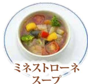
ミネストローネ スープ