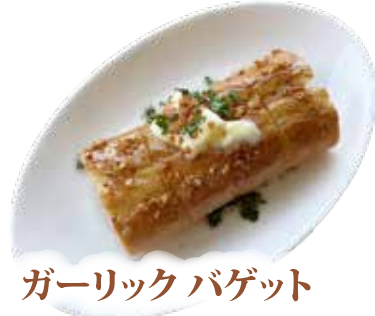
ガーリック バゲット ¥380 (¥418)