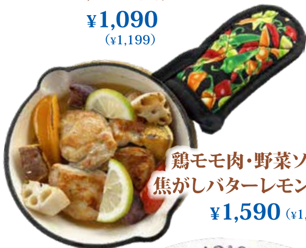
鶏モモ肉・野菜ソテー 焦がしバターレモンソース