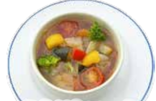
ミネストローネ スープ ¥380 (¥418)