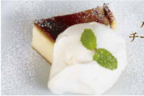
バスク風 チーズケーキ