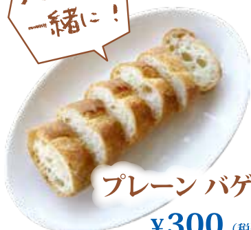
プレーン バゲット