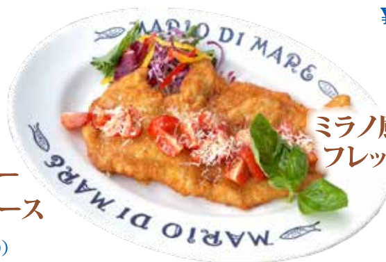
ミラノ風 ポークカツレット フレッシュトマトソース