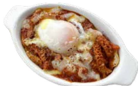
トリッパ(ハチノス)・温泉卵 トマト煮 グラタン