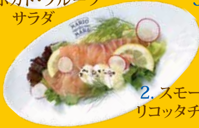
2. スモークサーモン リコッタチーズ サラダ