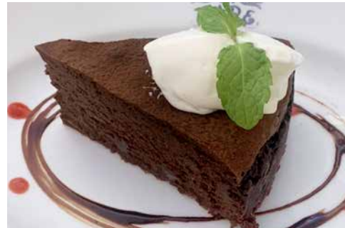
イタリアン チョコケーキ