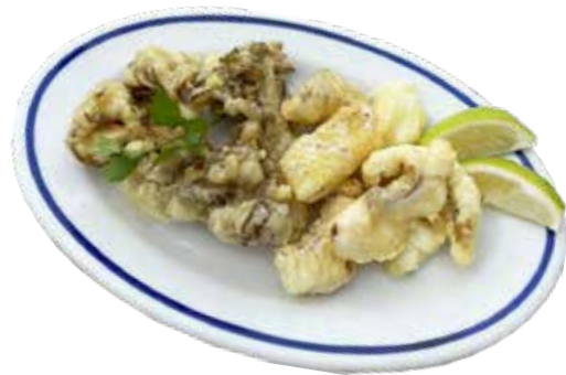
本鯛・女鹿平 舞茸のフリット クミン風味