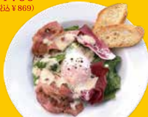
3. ベーコン・温泉卵 シーザーサラダ