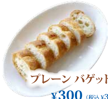
プレーン バゲット ¥300 (税込 ¥330)