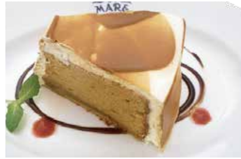
キャラメル シフォン