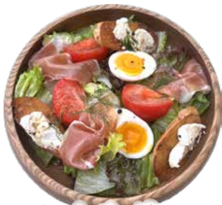
生ハム・チーズバケット イタリアン サラダ