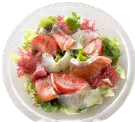
カルパッチョ・スモークサーモン シーフード サラダ