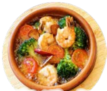
エビ・ブロッコリー・ミニトマト アヒージョ