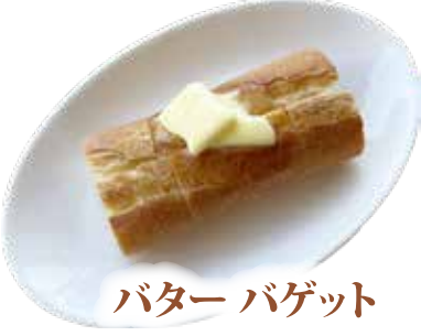
バター バゲット ¥350 (¥385)