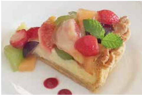
マリオの フルーツタルト