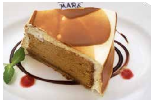
キャラメル シフォン