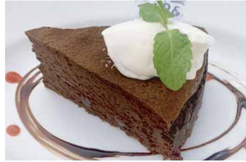
イタリアン チョコケーキ