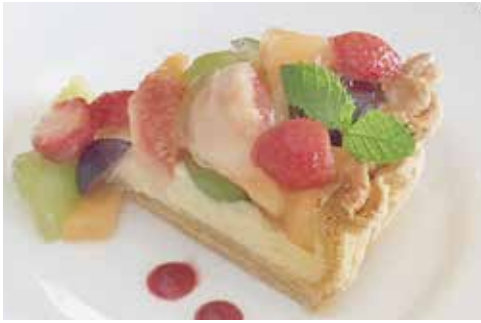
マリオの フルーツタルト