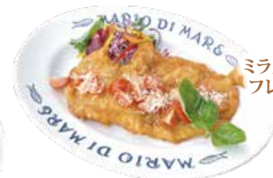
ミラノ風 ポークカツレツ フレッシュトマトソース ¥1,890 (¥2,041)