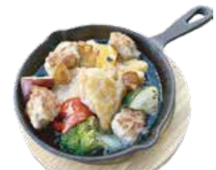
鶏モモ肉・自家製ソーセージ アヒージョ ¥1,890 (¥2,041)