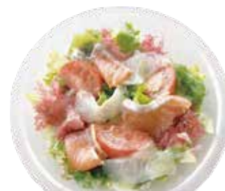
スモークサーモン・鯛 カルパッチョ サラダ ¥1,290 (¥1,393)