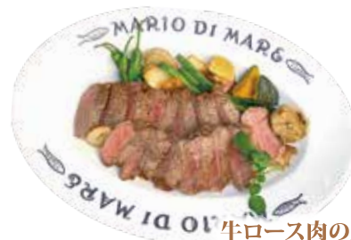
牛ロース肉のステーキ オニオンソース 250g ¥2,890 (¥3,121)