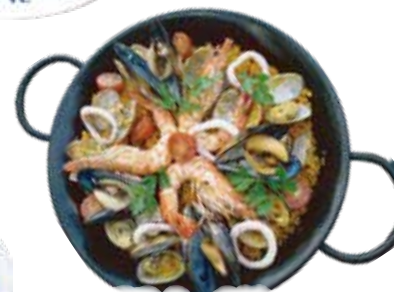
アサリ・ムール貝・有頭エビ マリオの海賊 パエリア 2人前 ¥2,890 (¥3,121)