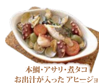
本鯛・アサリ・煮タコ お出汁が入った アヒージョ ¥1,890 (¥2,041)