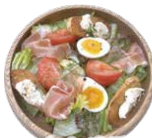
生ハム・チーズバゲット イタリアン サラダ ¥1,290 (¥1,393)