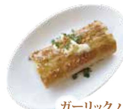
ガーリック バゲット ¥380 (¥410)