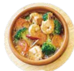
エビ・ブロッコリー・ミニトマト アヒージョ ¥1,090 (¥1,177)