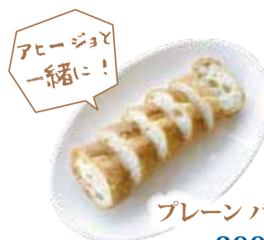
プレーン バゲット ¥300 (¥324)