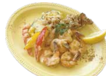
エビ・舞茸・野菜のフリット クミン風味 ¥1,090 (¥1,177)