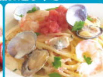
あさり・エビ たらこクリーム