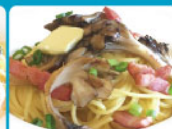
ベーコン・舞茸 和風バター