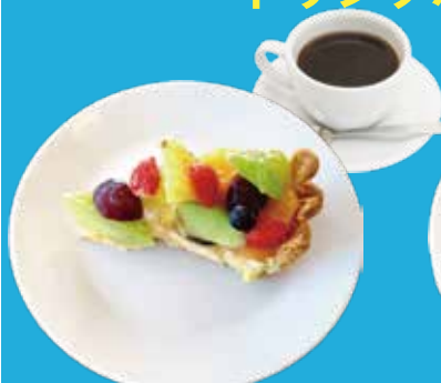
1. 季節のフルーツタルト