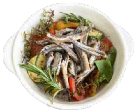
瀬戸内小イワシ・ハーブ アヒージョ ¥1,680 (¥1,848)