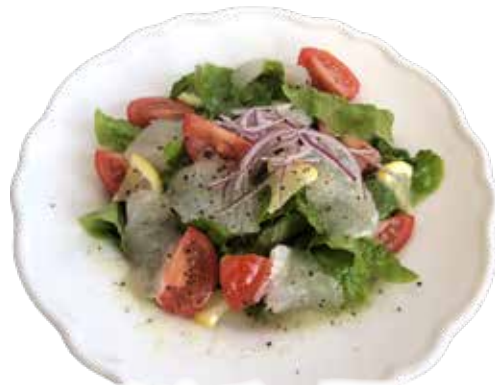
カルパッチョ サラダ フレンチドレッシング ¥1,380 (¥1,518)