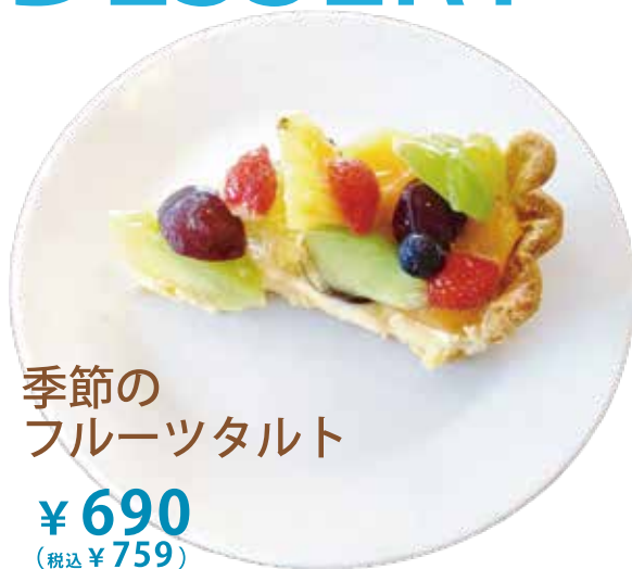
季節の フルーツタルト