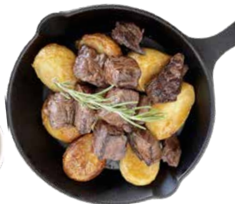
牛ハラミ サイコロステーキ ¥1,980 (¥2,178)