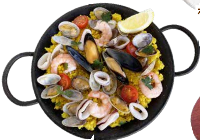
地中海風 パエリア ムール貝・エビ・あさり・イカ ¥1,880 (税込¥2,068)