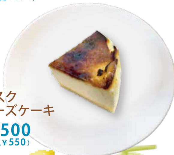
巴斯ク チーズケーキ