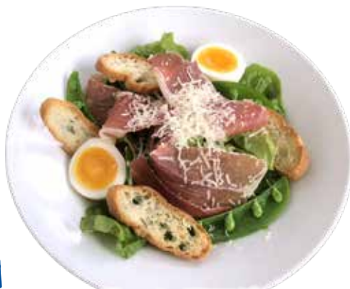
生ハム サラダ イタリアンドレッシング ¥1,180 (税込¥1,298)