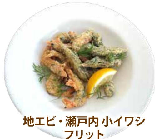
地エビ・瀬戸内小イワシ フリット ¥1,580 (¥1,738)