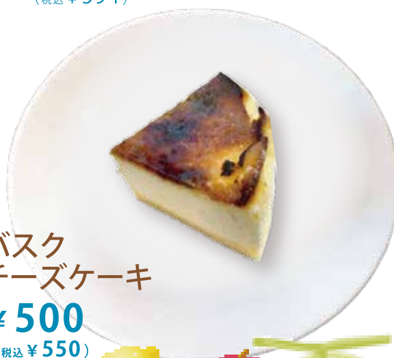
巴斯ク チーズケーキ