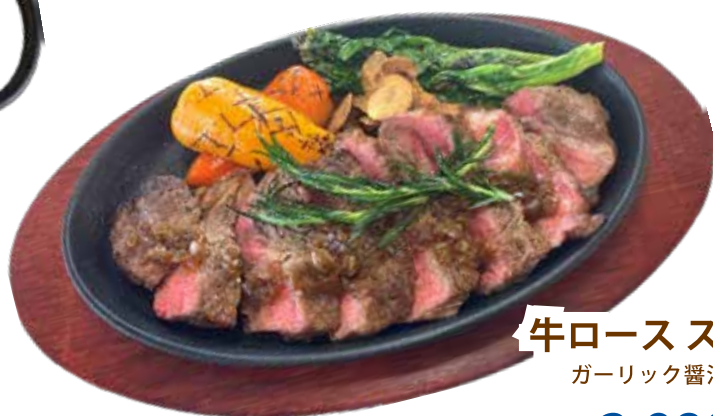
牛ロースステーキ ガーリック醤油ソース ¥2,980 (¥3,278)