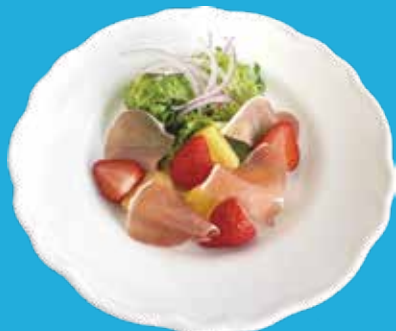
1. 生ハム・フルーツサラダ バルサミコドレッシング