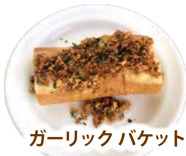
ガーリックバケット