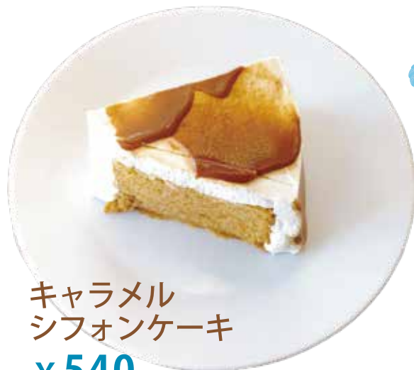
キャラメル シフォンケーキ