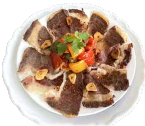
広島名物 コウネ ピリ辛ガーリック焼き ¥1,680 (¥1,848)