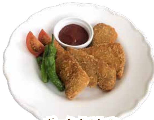
ポーク カツレツ ¥1,480 (¥1,628)