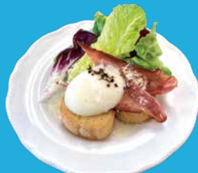
3. ベーコン・温泉卵 サラダ シーザードレッシング