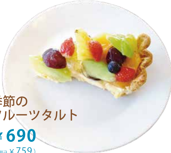
季節の フルーツタルト