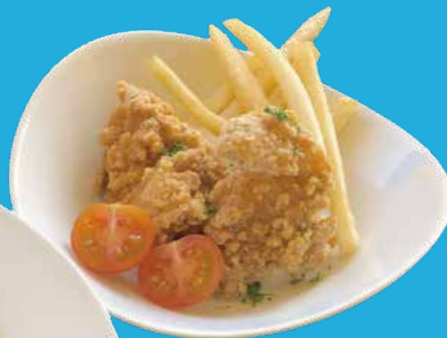
チキンのからあげ & フライドポテト