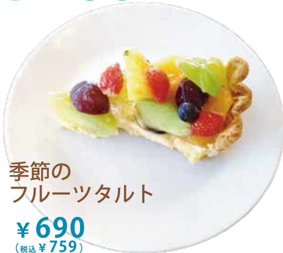
季節の フルーツタルト