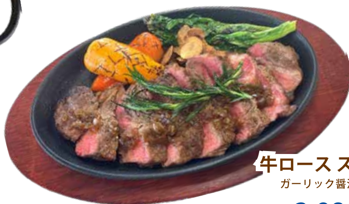
牛ロースステーキ ガーリック醤油ソース