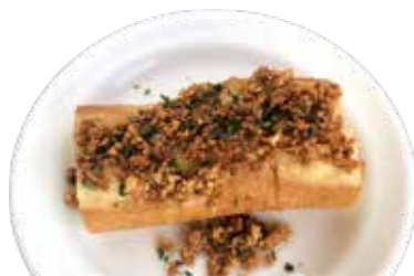
ガーリックバケット