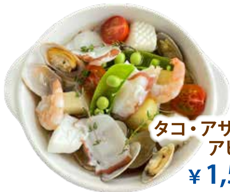
タコ・アサリ・エビ・イカ アヒージョ