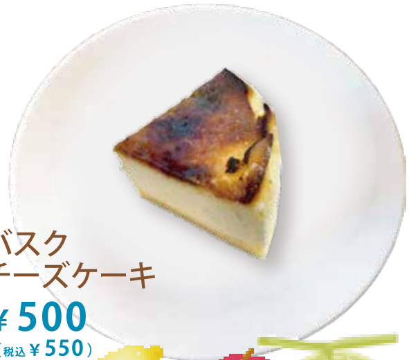
巴斯ク チーズケーキ