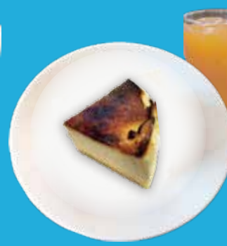
4. バスクチーズケーキ