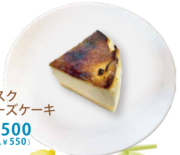
巴斯克 チーズケーキ