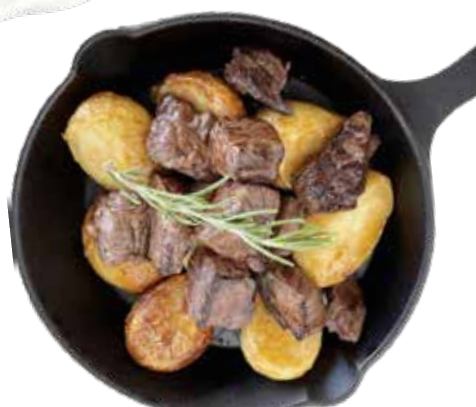
牛ハラミ サイコロステーキ