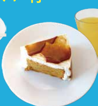
2. キャラメルシフォン