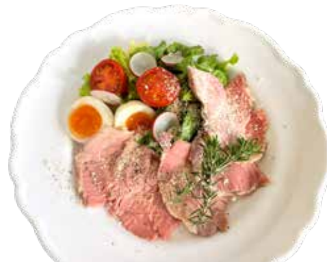
自家製ロースハムのサラダ シーザードレッシング