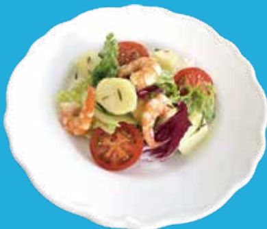
2. エビ・ポテト サラダ バリバリドレッシング