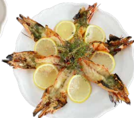
有頭エビのグリル