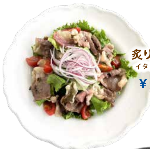
炙りコウネサラダ イタリアンドレッシング