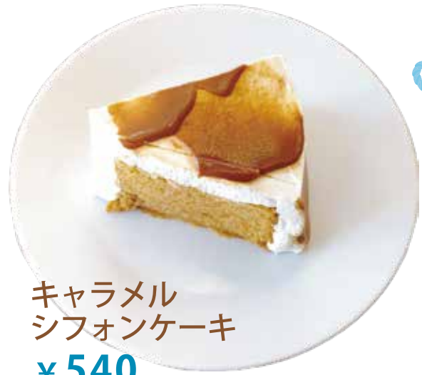
キャラメル シフォンケーキ