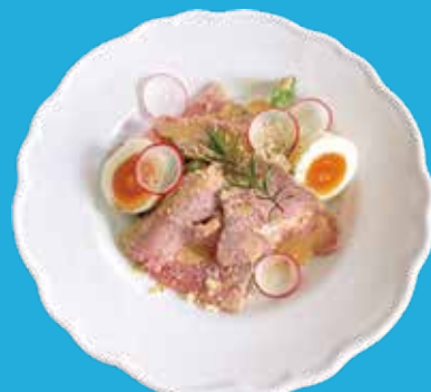
3. 自家製ロースハムサラダ シーザードレッシング