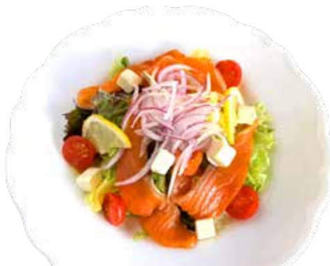
スモークサーモン クリームチーズサラダ フレンチドレッシング