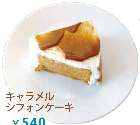
キャラメル シフォンケーキ