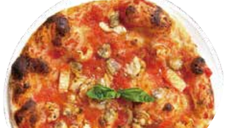
2 魚介たっぷりトマトソース ペスカトーラ