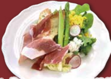
1. 生ハム・アスパラ サラダ バルサミコ酢ドレッシング