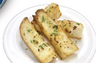
ガーリックバター バゲット