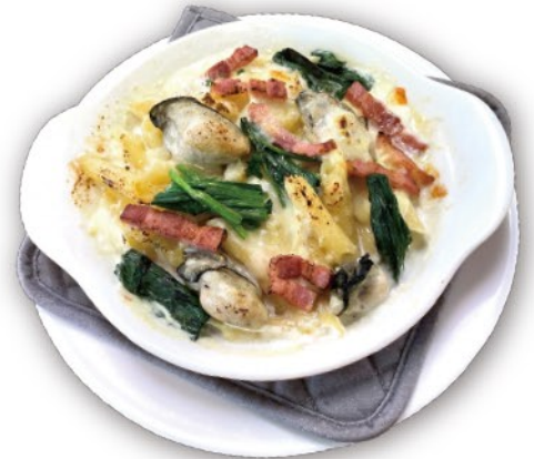
牡蠣・ベーコン・ホウレン草 ペンネグラタン