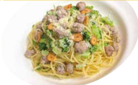
6 自家製ソーセージ ブロッコリー・パルメザン