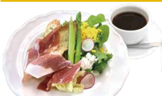
1. 生ハム・アスパラ サラダ バルサミコ酢ドレッシング