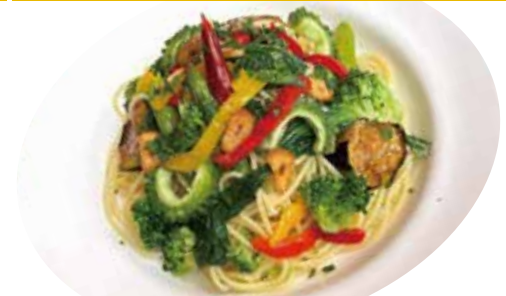
7 季節野菜・アンチョビ 大葉 ペペロンチーノ