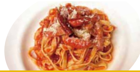
4 ベーコン・オニオン・唐辛子 辛口トマトソース