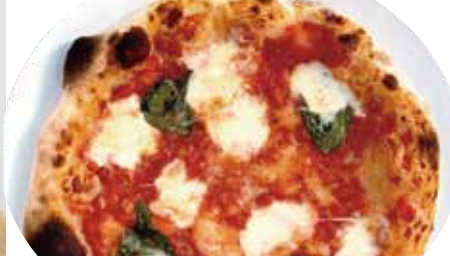
1 モッツアレラ・バジル トマトソース マルゲリータ