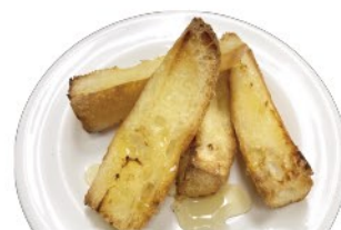
はちみつバター バケット