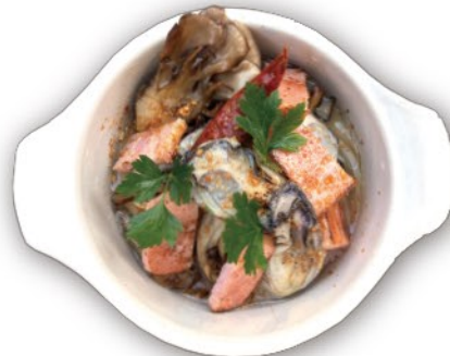
牡蠣・ベーコン・舞茸 アヒージョ