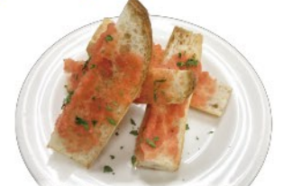
明太子バター バケット