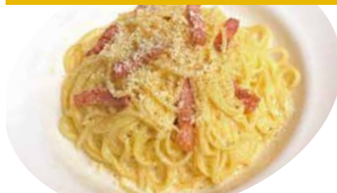
9 ベーコン・オニオン・卵 カルボナーラ