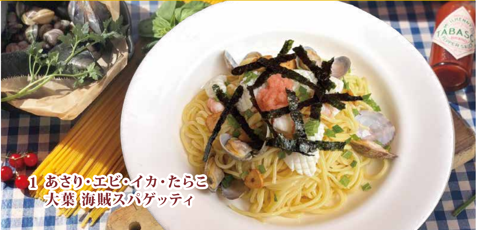
1 あさり・エビ・イカ・たらこ 大葉 海賊スパゲッティ