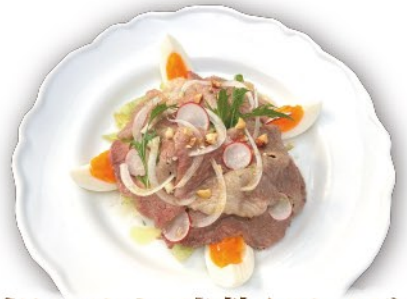
炙りコウネ・半熟卵サラダ バルサミコドレッシング