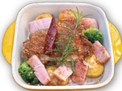
鶏もも肉・ベーコン・ポテト アヒージョ