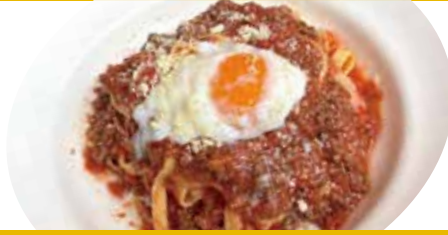
2 自家製ミートソース 温泉卵