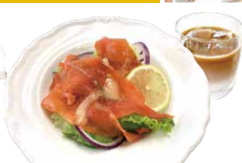
2. サーモン・オニオン サラダ フレンチマスタードドレッシング