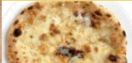
3 はちみつ イタリア 4大チーズ