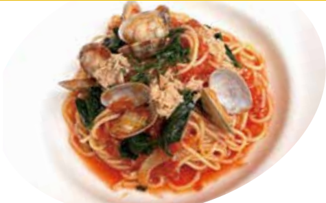
5 あさり・ツナ・ほうれん草 トマトソース