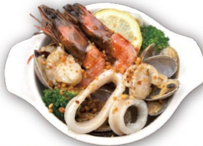
アサリ・エビ・イカ・ホタテ アヒージョ