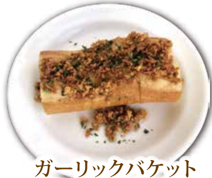
ガーリックバケット