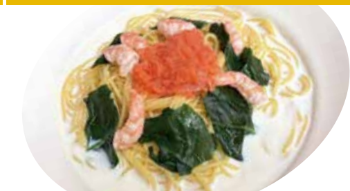
10 エビ・ほうれん草 たらこクリームソース