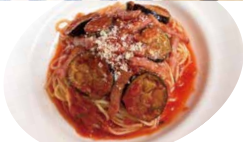
2 ベーコン・揚げナス パルメザン トマトソース