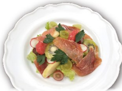
生ハム・フルーツサラダ イタリアンドレッシング