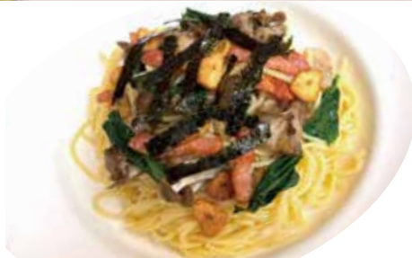
3 ベーコン・キノコ・小松菜 和風 スパゲッティ