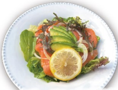
スモークサーモン・アボカドサラダ フレンチドレッシング