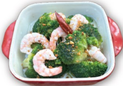
エビ・ブロッコリー アヒージョ