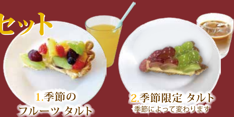
1. 季節の フルーツ タルト