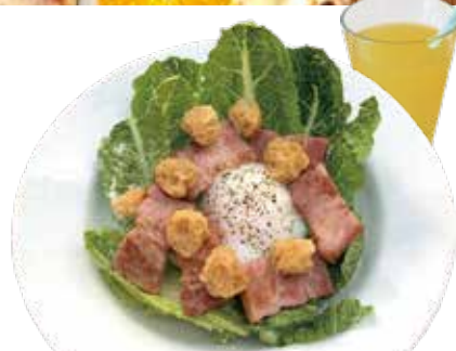
3. スモークベーコン・温泉卵 サラダ シーザードレッシング