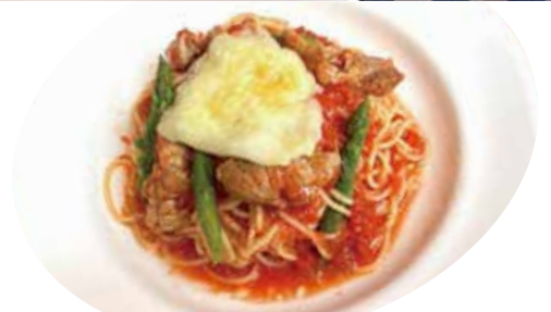
4 チキン・アスパラ モッツアレラ トマトソース