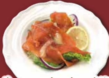
2. サーモン・オニオン サラダ フレンチマスタードドレッシング