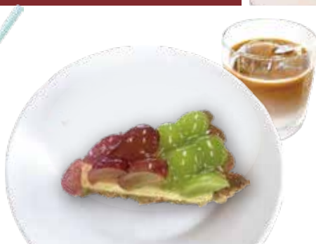
2. 季節のおすすめ タルト 季節によって変わります