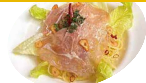
8 生ハム・ロメインレタス ペペロンチーノ