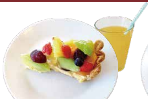
1. 季節のフルーツ タルト