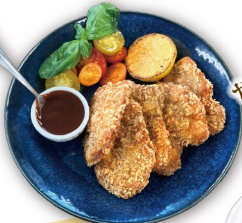
やわらかポーク カツレツ