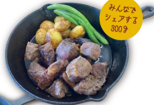
牛サイコロステーキ