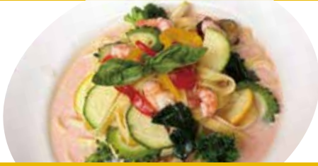
1 エビ・緑黄色野菜 クリームソース