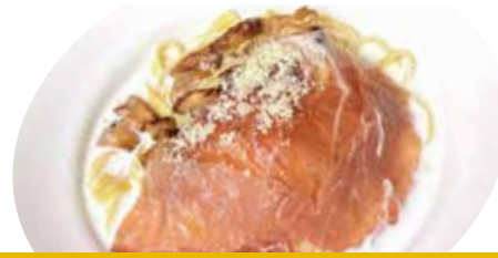
3 生ハム・ポルチーニ茸 クリームソース