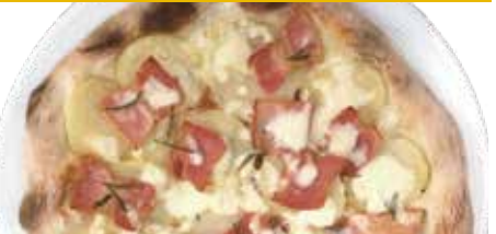
4 ベーコン・ポテト モッツアレラ・ローズマリー